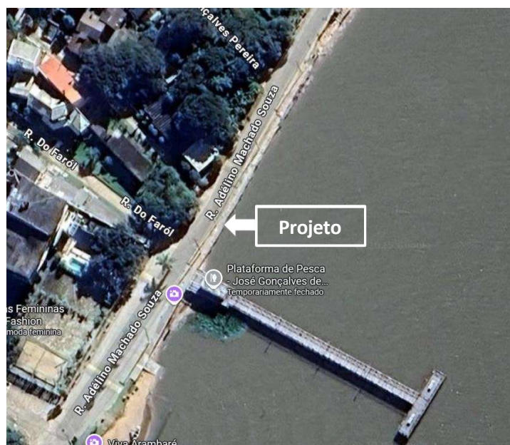
Figura 1: Localização da área do projeto